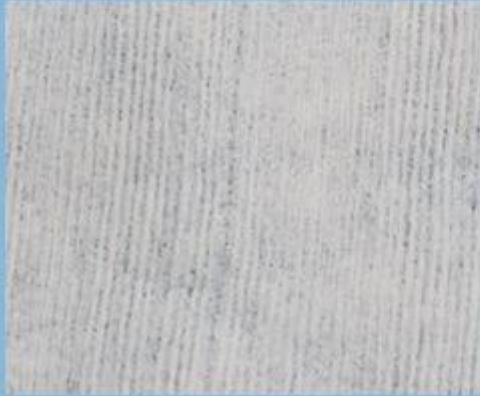
viscose & polyester / parallel