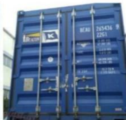
Loading and delivery