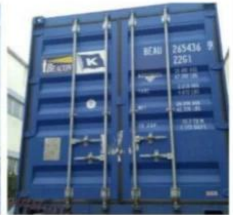
Loading and delivery